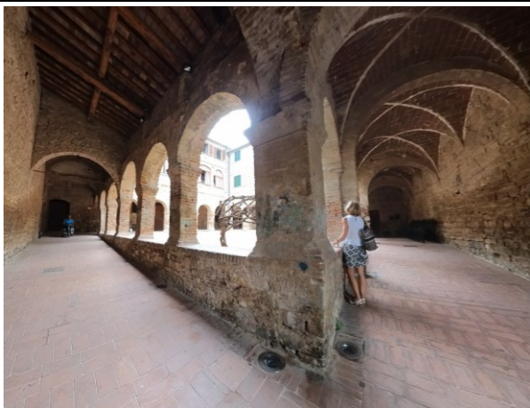
Chiostro di San Francesco

L'ex Convento di San Francesco, costruito nel 1288 e soppresso in epoca napoleonica, oggi è stato riconvertito in abitazioni private. Del convento possiamo ancora apprezzare il chiostro che, con i suoi portici ben conservati, crea un ambiente piacevole e tranquillo.