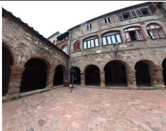
Chiostro di San Francesco